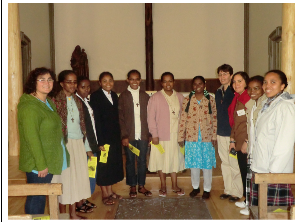
Groupe des Sœurs de la session internationale